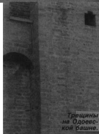
Трещины на Одоевс- кой башне.

Но пришёл указ Екатерины II о ремонте Тульского кремля, который был осуществлен в 1784 году. Во время этого ремонта Одоевская башня получила надстройку в виде купола со шпилем, на котором тогда же был водружен герб России - двуглавый орел, просуществовавший до Октябрьской революции 1917 года. Сегодня Одоевскую башню венчает герб г. Тулы.